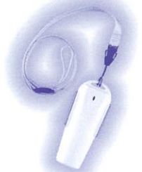
ワイヤレス緊急ペンダント (EP-02W)