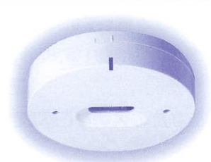
ワイヤレス接点送信機 (TM-03W)