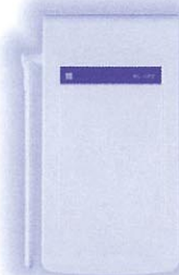
小電力ワイヤレスリピーター (WS-RP2)