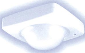
ワイヤレスパッシブセンサ (KP7110W)

人体からの赤外線(体温)を検知するセンサです。壁面、天井面どちらにも設置できます。