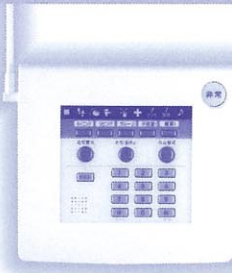
コントロールコミュニケーター (KFC-606)