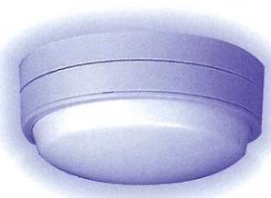
差動式熱感知器 火災センサー